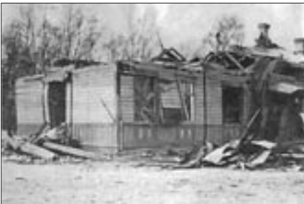
Seinäjoen aseman odotushuone pommituksen jälkeen.

42 DBAP oli saapunut Orelin sotilaspiiristä Kretshevitsyyn 15.–21.1.1940. Kretshevitsy sijaitsee Novgorodin kaupungista noin 10 km pohjoiskoilliseen. Rykmentti oli taisteluvälmiinä 30.1.40, jolloin sen vahvuus oli 45 DB-3 konetta. Ensimmäisen sotalentonsa rykmentti teki juuri 3.2.40, jolloin pommitusmaaleina olivat käskyn mukaan Jyväskylän asema ja Kuopion ammustehdas, varamaalina Joensuun asema. Suomalaislentäjät ampuivat edellä mainitut DB-3 koneet alas miltei samanaikaisesti klo 15.10 ja klo 15.12. Kun Jyväskylää ja Joensuuta ei kyseisenä päivänä pommitettu lainkaan, ja kun Kuopion pommituskin tapahtui jo klo 11.35, herää kysymys, mistä pommituskohteesta alas ammutut koneet olivat tulossa. Muita kellonaikaa, koneiden määrään ja tyyppiin (DB) sekä lentoreittiin sopivia kohteita en kyseiselle päivälle ole löytänyt kuin Seinäjoen, jota 27 DB konetta pommitettiin klo 13.40.